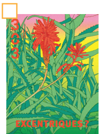
Excentriques N° 146 - 2017 - 96 p.