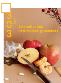
Arts culinaires N° 151 - 2018 - 256 p.