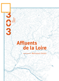
Affluents de la Loire N° 130 - 2014 - 256 p.