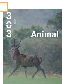
Animal N° 159 - 2019 - 96 p.

Un numéro trimestriel au choix pour un abonnement de deux ans ou à durée libre