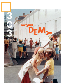
Jacques Demy N° 115 - 2011 - 96 p.