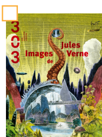
Images de Jules Verne N° 134 - 2014 - 200 p.