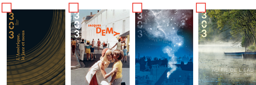
L'Amérique, le jazz et nous 2014 - 104 p. - 15 €