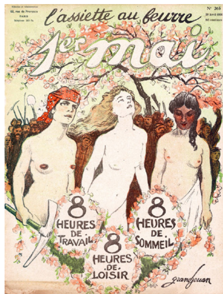
« Premier mai », Jules Grandjouan L'Assiette au Beurre, n° 265, 28 avril 1906.