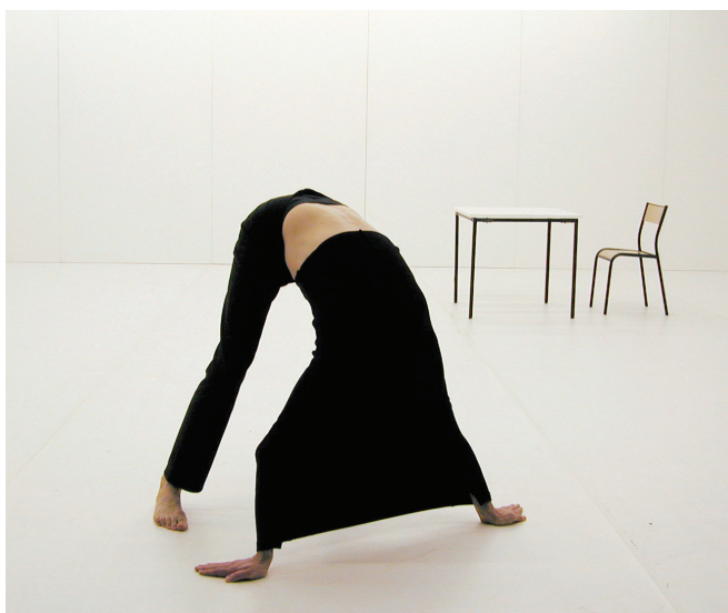
Self Unfinished , Xavier le Roy, 1998.

Tél : 02 28 20 63 07 Mob : 06 25 28 25 92 Fax : 02 28 20 50 21 diffusion@revue303.com