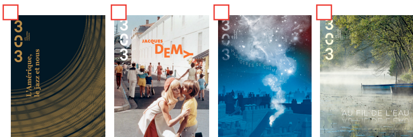
L'Amérique, le jazz et nous 2014 - 104 p. - 15 €